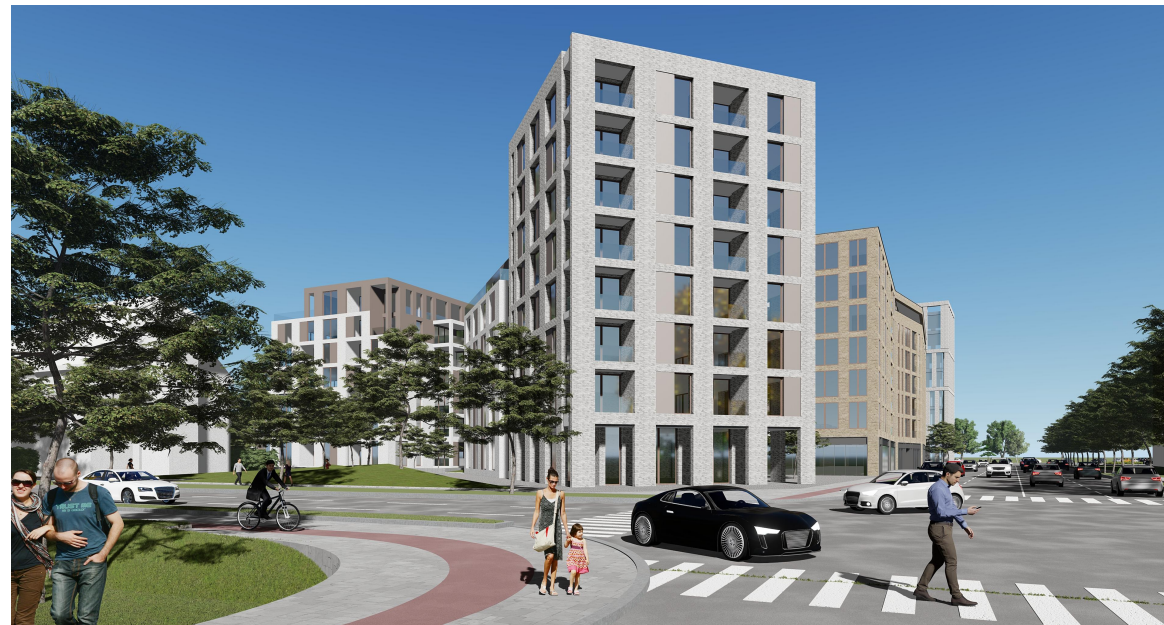
Perspectivă Pod Jiul