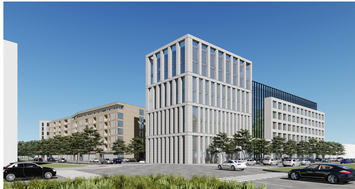
Perspectivă Bd. Republicii