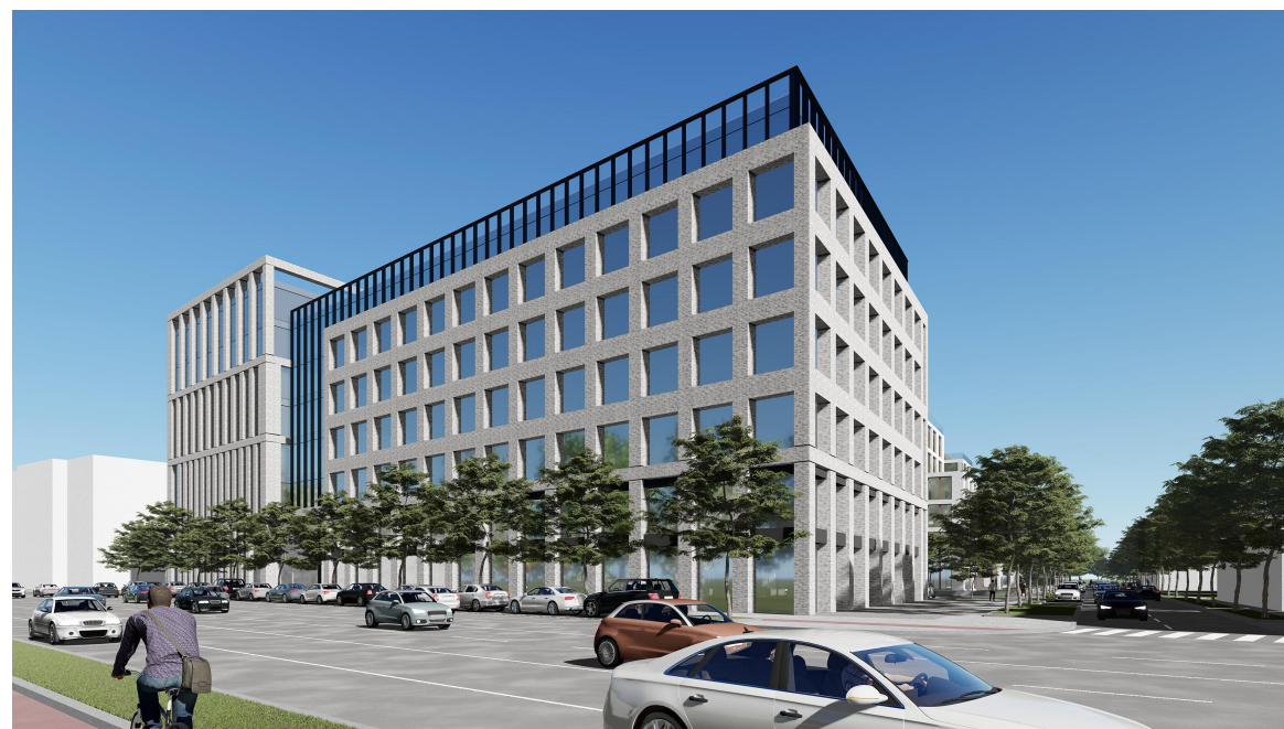
Perspectivă Bd. Republicii